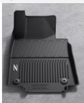
Tapis de sol toute saison - High Wall Liner CHF 280 00