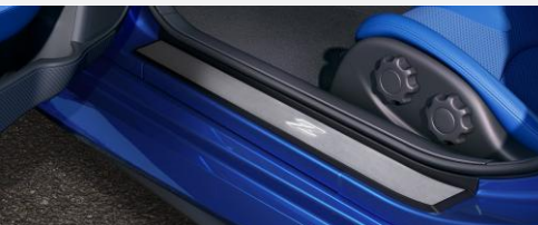
Tôles de marchepied éclairées (argent) avec Acc. Service Connector CHF 374