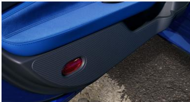
Protection contre les frottements pour l'intérieur des portes CHF 130