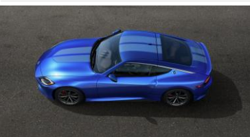
Double bande de course, spoiler arrière inclus CHF 900