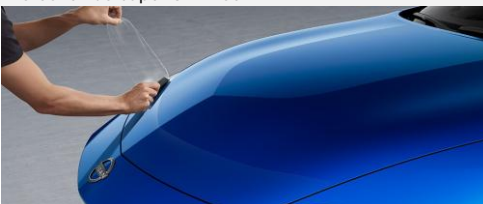
Protection du capot CHF 250