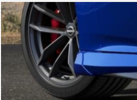
Protection anti-éclaboussures à l'avant CHF 145 00