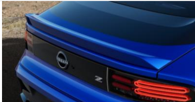
Spoiler arrière (uniquement pour la version Sport), montage inclus CHF 990 00