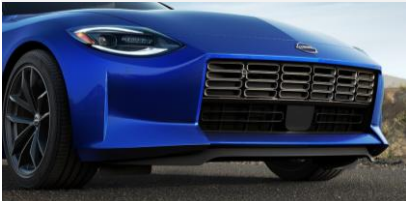
Spoiler avant (uniquement pour la version Sport), montage inclus CHF 390