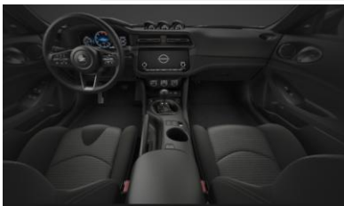
Équipement de série