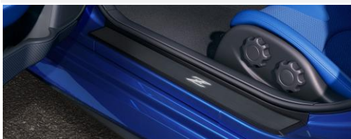
Tôles de marchepied éclairées (noir) avec Acc. Serv. Connector CHF 544