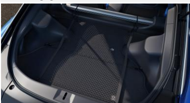
Filet à bagages CHF 60