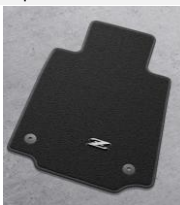
Tapis de sol Premium (avec logo Z) CHF 300