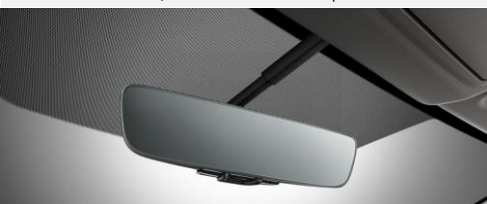
Rétroviseur sans cadre, à atténuation automatique de la luminosité CHF 420