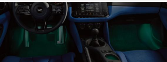
Eclairage intérieur d'accentuation avec Accessory Service Connector CHF 524