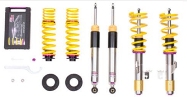
KW V3 suspension filetée CHF 2'655