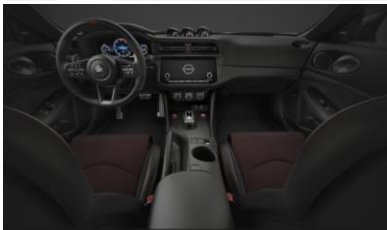
Équipement de série