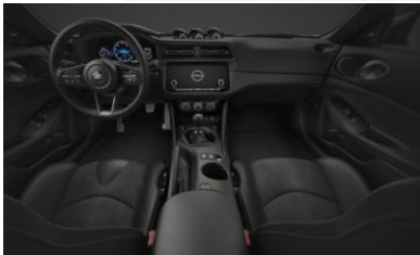
Équipement de série