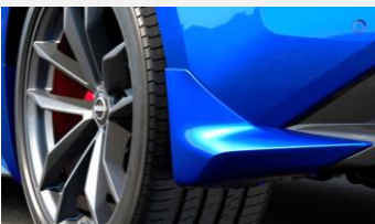
Protection anti-éclaboussures à l'arrière CHF 170