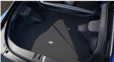
Protection pour le coffre - Moquette CHF 130